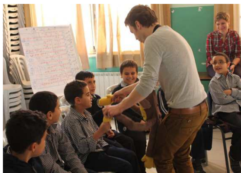
Musikalische Sprachlernförderung durch Musikpädagogen