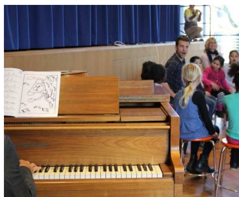
Musikalische Sprachlernförderung durch Musikpädagogen