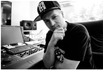
Sleepwalker ist DJ, Rapper und Hip-Hop-Produzent