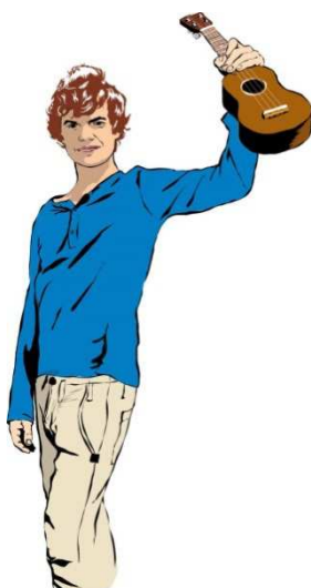
Auftaktkonzert mit „Mit Krone und Hund“