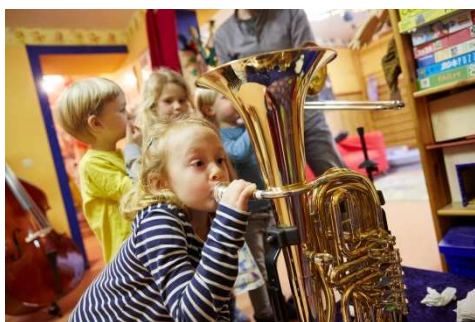
Das Klingende Mobil: Instrumente zum Ausprobieren