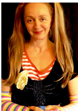
Abschlusskonzert mit Hexe Knickebein