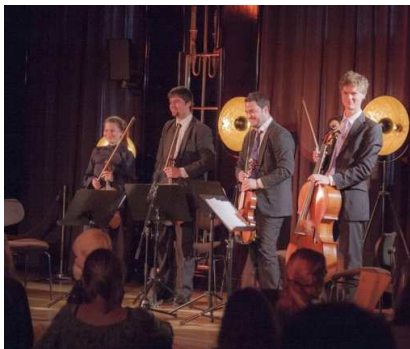
Auftaktkonzert mit dem D.U.R. Quartett